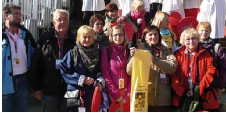
Oben: Fototermin auf den Dombtreppen. Unten: Vor dem Hauptaltar.